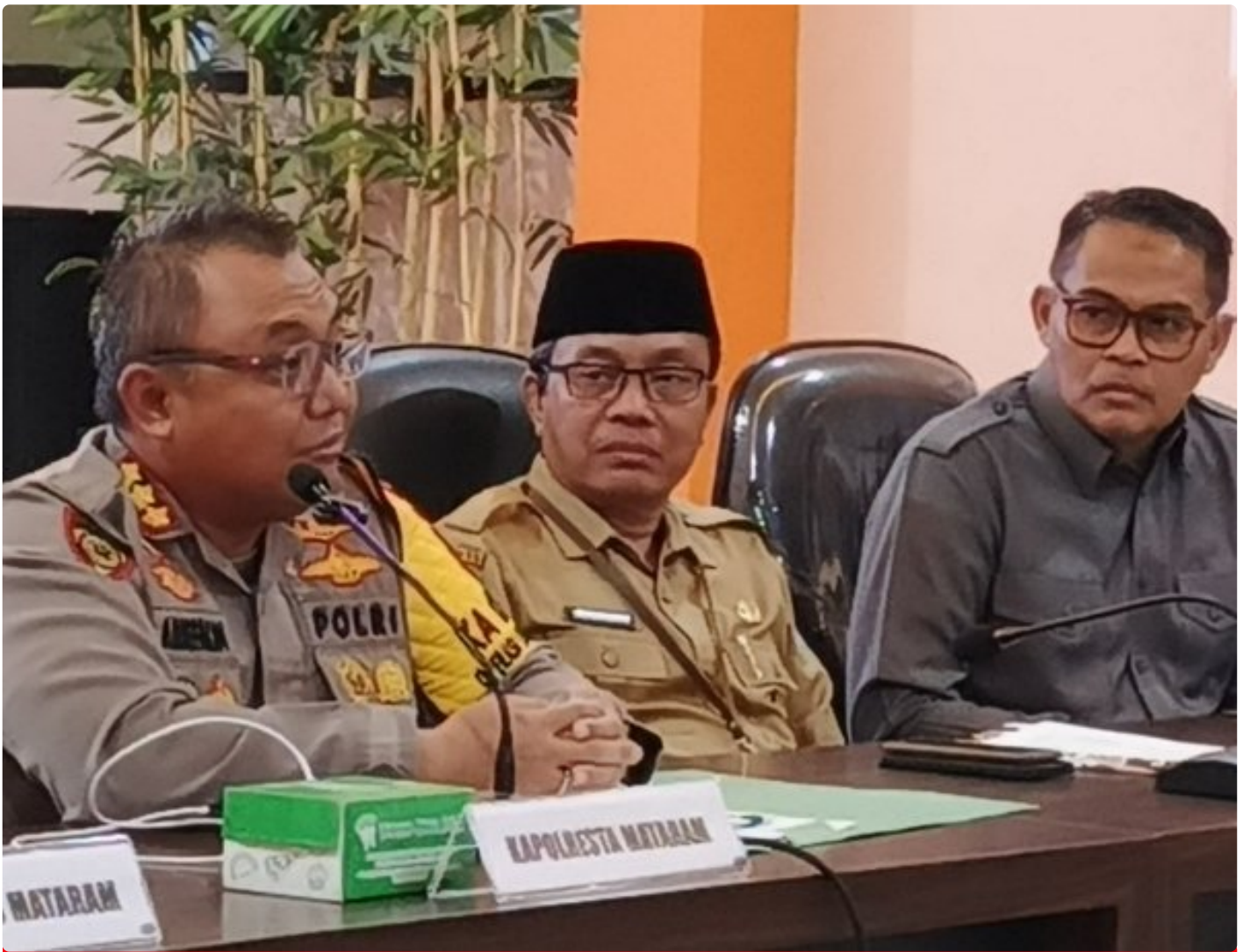
Kapolresta Mataram (Kiri) saat memimpin Konferensi pers akhir tahun, Selagi (31/12/2024)