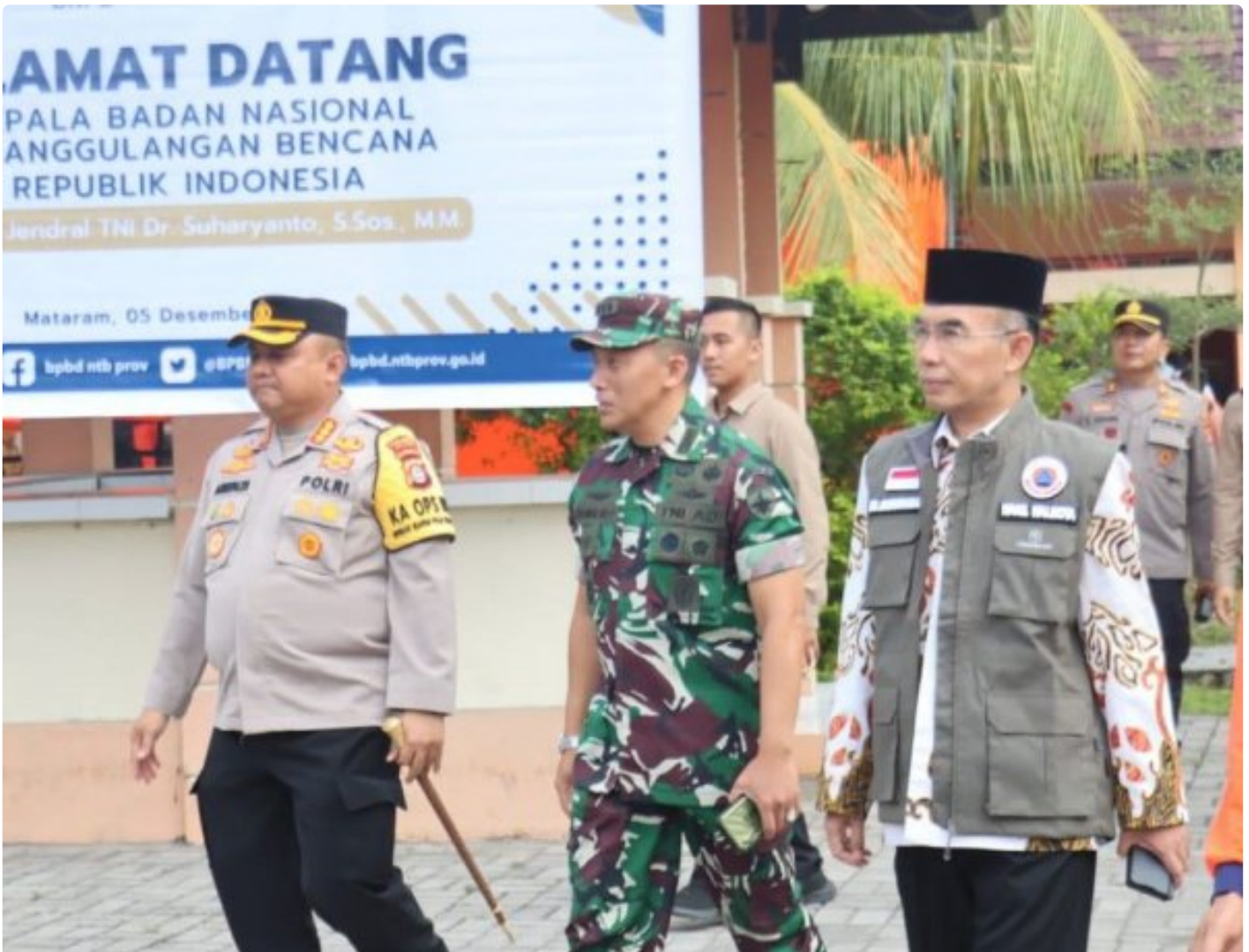
Kapolresta Mataram (Kiri) saat menghadiri acara Peletakan batu Pertama pembangunan gedung Pusdalops BPBD NTB, Kamis (05/12/2024)