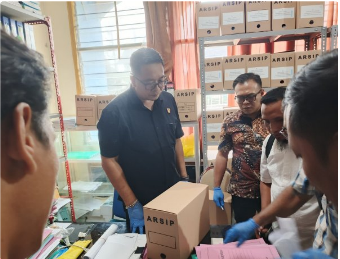
Saat Pengeledahan di Dikbud NTB, Jumat (13/12/2024)

MATARAM, NTB – Dugaan praktik pungutan liar (pungli) dalam proyek Dana Alokasi Khusus (DAK) tahun 2024 di SMK 3 Mataram terus diusut. Dalam